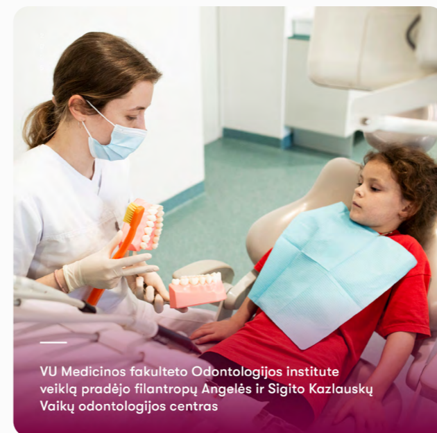
VU Medicinos fakulteto Odontologijos institute veiklą pradėjo filantropų Angelės ir Sigito Kazlauskų Vaikų odontologijos centras