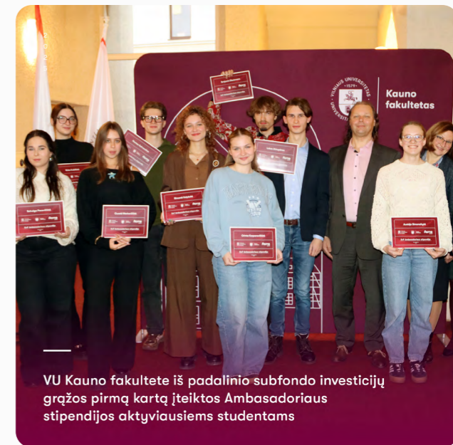
2025 VU Kauno fakultete iš padalinio subfondo investicijų gražus pirmą kartą įteiktos Ambasadoriaus stipendijos aktyviausiems studentams