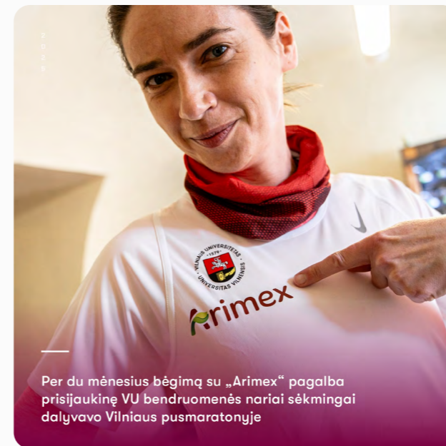
2025 Per du mėnesius bėgimą su „Arimex“ pagalba prisijaukinę VU bendruomenės nariai sėkmingai dalyvavo Vilniaus pusmaratonyje