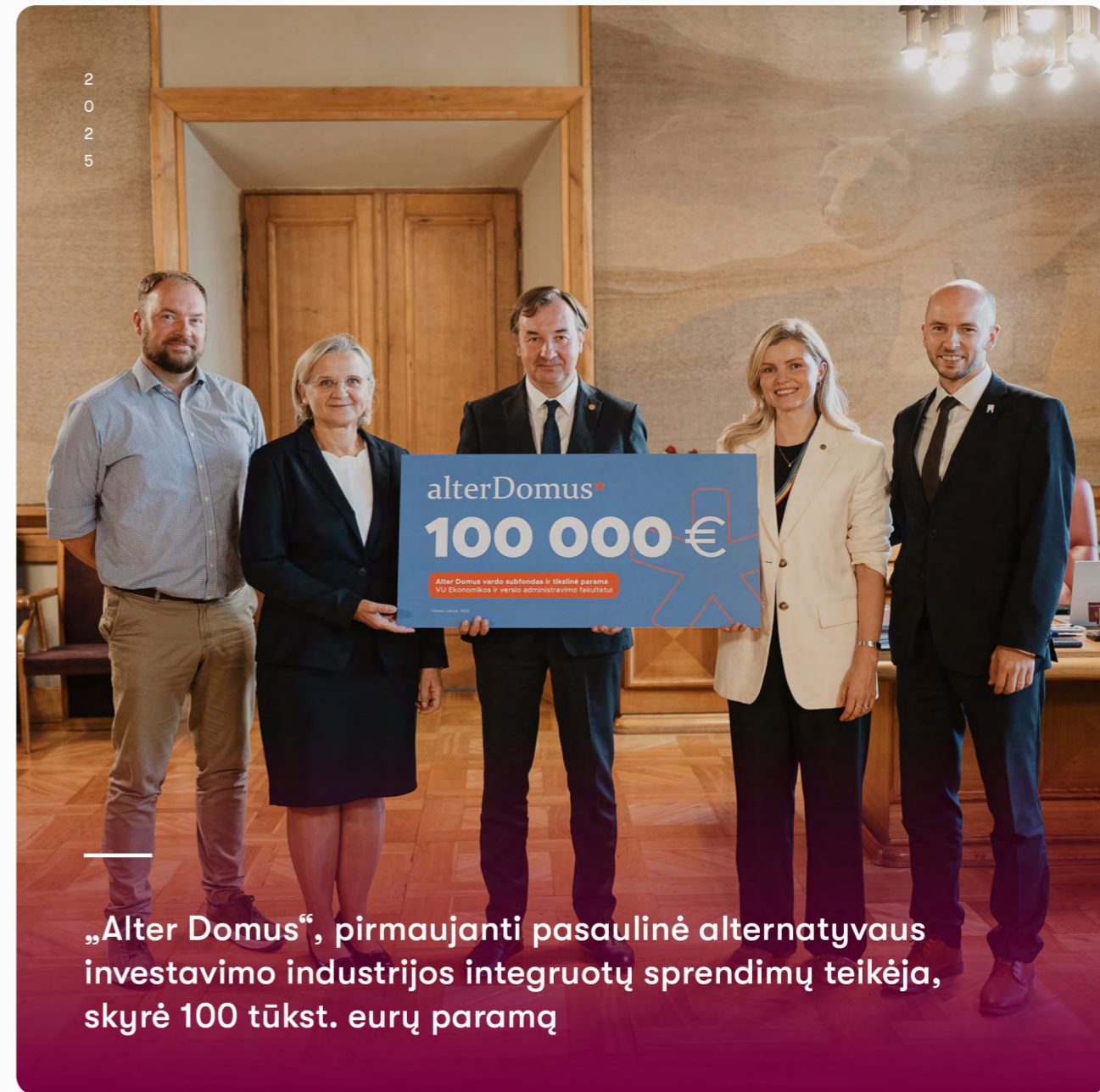
2025 „Alter Domus“, pirmaujanti pasaulinė alternatyvaus investavimo industrijos integruotų sprendimų teikėja, skyrė 100 tūkst. eurų paramą