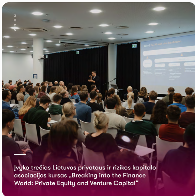
2025 Įvyko trečias Lietuvos privataus ir rizikos kapitalo asociacijos kursas „Breaking into the Finance World: Private Equity and Venture Capital“