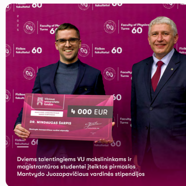
Dviems talentingiems VU mokslininkams ir magistrantūros studentei įteiktos pirmosios Mantvydo Juozapavičiaus vardinės stipendijos