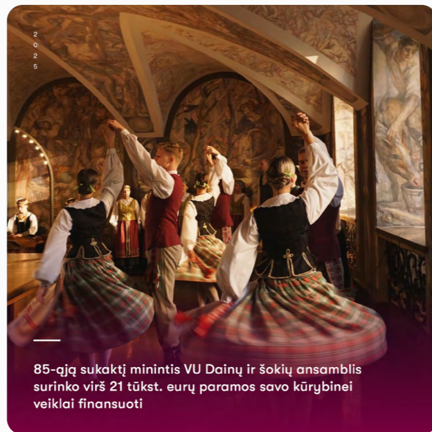
2025 85-ąją sukaktį minintis VU Dainų ir šokių ansamblis surinko virš 21 tūkst. eurų paramos savo kūrybinei veiklai finansuoti